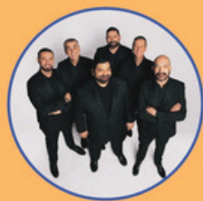
NERI PER CASO