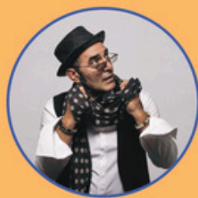
FRANCESCO BACCINI Duo

dal 23 al 25 LUGLIO Rive d'Autore - II Edizione